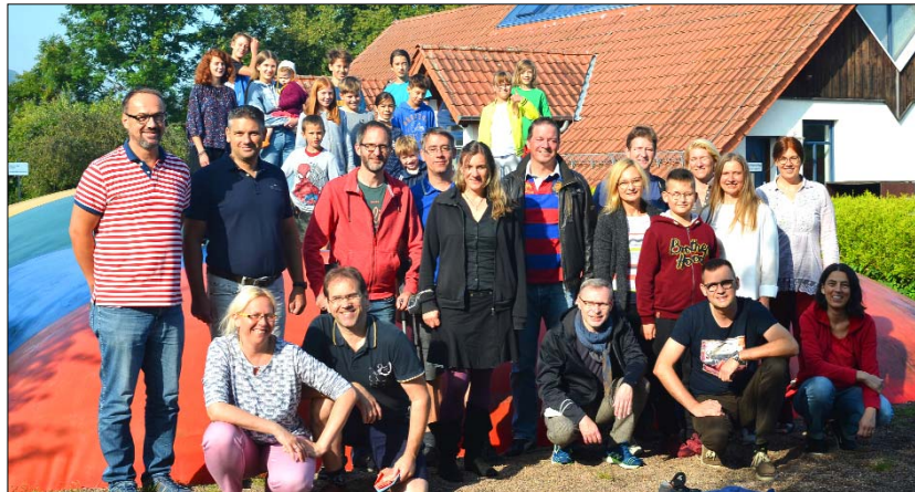
Endlich mal wieder ein Treffen der Warmisi von Angesicht zu Angesicht nicht nur zur Freude der Kinder, sondern auch der Eltern.

Ich war dieses Jahr zum ersten Mal dabei. In den neunziger Jahren