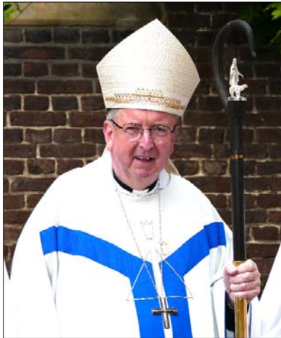
Weihbischof Horst Eberlein aus Hamburg

Es war eine unaufgeregte und klare Haltung in einer Welt, in der alle meine Freunde nicht zur Kirche gehörten und kaum einer mit an Gott glaubte. Im Glauben war et-