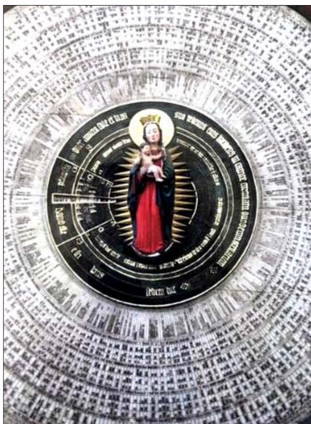
Astronomische Uhr in der Marienkirche zu Danzig