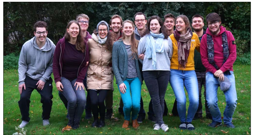
Man sollte die Welt auch mal aus anderer Perspektive betrachten.