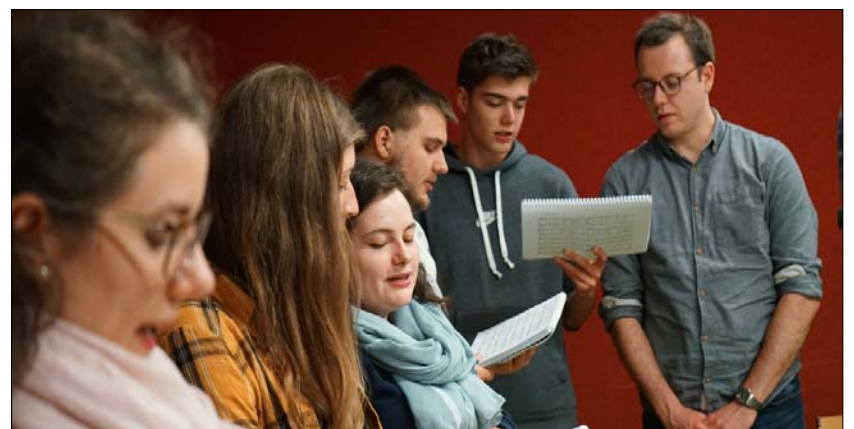
Endlich mal wieder gemeinsames Singen beim Gottesdienst.