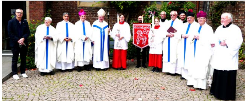
Alle beim festlichen Wallfahrtsamt in Kevelaer am 17. Oktober 2021 Teilnehmenden.

denn egal mit wem man redete, jeder äußerte sich lobend über die Predigt des Gastes aus der weltoffenen Hansestadt.