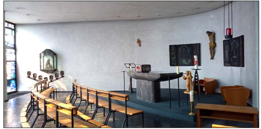
St. Andreas Kapelle mit Altarbildern aus Helle

Für alle die das Ermlandhaus einmal von innen sehen wollen, führt Präses Achim Brennecke in einem weiteren Video durch das Haus, das seit 60 Jahren die Zentrale der Ermlandfamilie und ein Geistliches Zentrum für die vertriebenen Ermländer, Aussiedler und deren Nachkommen ist.