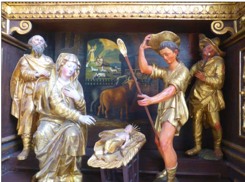
Sammarei, Niederbayern, Wallfahrtskirche Maria Himmelfahrt, Krippendarstellung im Schnitzaltar von 1647

die Gottesmutter, zeigt auf das Kind, als ob sie sagen möchte: „Ich habe das Kind für euch geboren!“ Der heilige Josef steht hinter Maria und stärkt sie in ihrer Aufgabe. Auch er und Maria tragen goldene Gewänder, denn was hier geschieht, ist von göttlichem Glanz erfüllt und erleuchtet alle, die auf das Kind schauen.