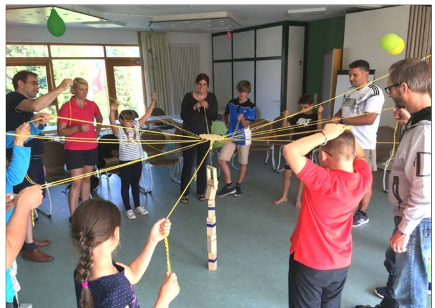
Nur gemeinsam gelingt es, Großartiges zu verwirklichen. - Warmisi-Tagung 2021 in Uder.

Anmeldungen und Fragen gerne per Mail an: veronika.lange@aktion-west-ost.de