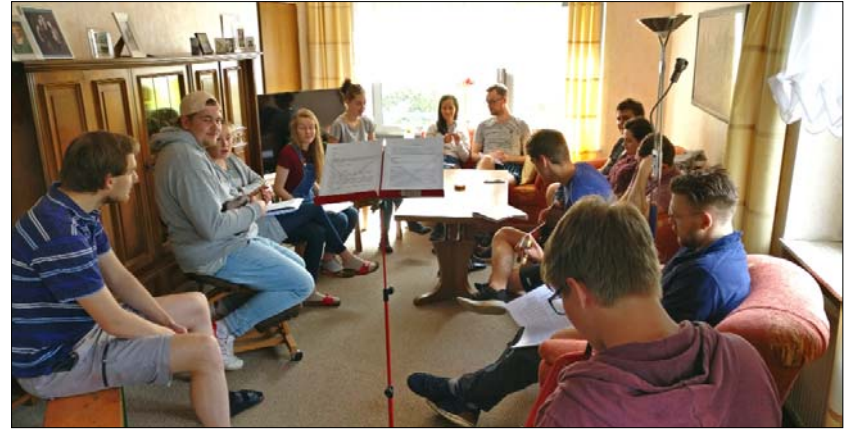
Endlich mal wieder ein gemeinsamer Gottesdienst