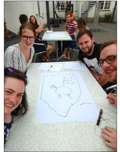
Ein ermländisches Meisterwerk

Da war es besonders schön, nicht nur ernste, schwerwiegende Themen zu behandeln, sondern in Gruppen gegeneinander anzutreten mit verschiedenen gemeinsamen Herausforderungen: Beispielsweise mussten wir gemeinsam Bilder malen, indem wir nur einen Stift hatten, der dadurch geführt wurde, dass jedes Gruppenmitglied einen daran befestigten Faden ziehen oder lockerlassen musste. Dabei sind durchaus einige interessante Kunstwerke ent-