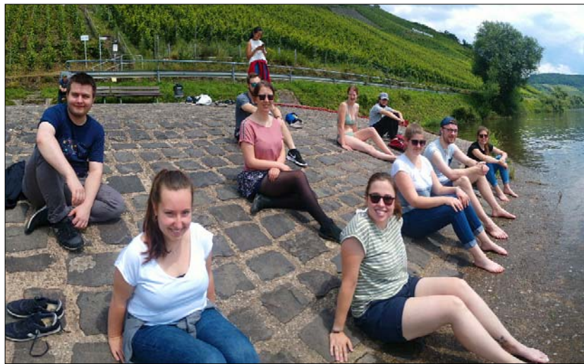
Frische Abkühlung in den sonnigen Weinbergen